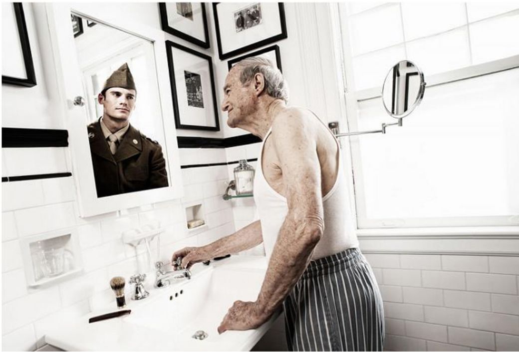
Приложения. Фрагмент проекта косплея «Медсестра Наташа»»